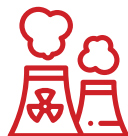
Électrique | Nucléaire